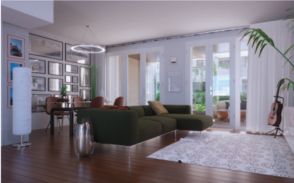
Green Coop Soc Coop Edilizia ha sede a Baranzate (Mi) - www.lagreencoop.it - info@lagreencoop.it

distribuiti in un'area di 8mila mq. Ogni palazzina si affaccia su queste aree verdi, in modo tale che si possano sempre tenere sott'occhio i figli che giocano all'aperto e creando, nello stesso tempo, un senso di comunità protetta tra gli inquilini. La presenza di numerosi alberi, piante e verde, che caratterizza l'intero villaggio, contribuisce in larga parte ad aumentare la vivibilità degli appartamenti. Infine, è stato realizzato un edificio polivalente ad uso comune a tutti gli abitanti del villaggio, adatto per feste, riunioni condominiali, installazioni di postazioni multimediali e qualsiasi attività, contribuendo a rendere l'intervento un progetto di grande qualità».